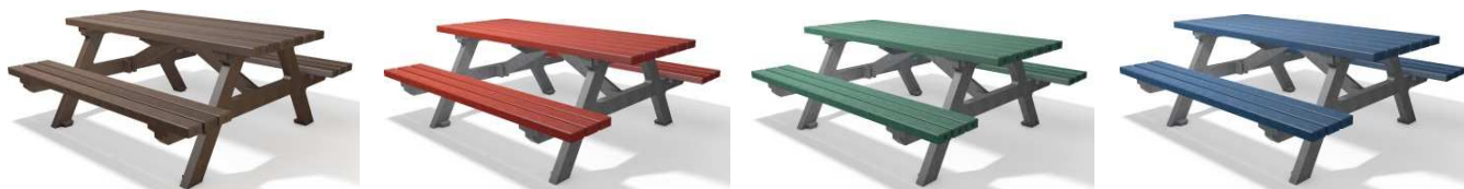
Table H pique-nique 200/240cm